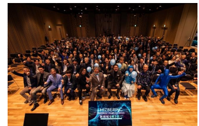
ミズベリングフォーラム 2023 の模様