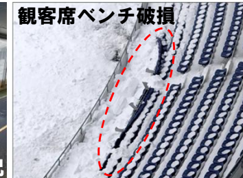
観客席ベンチ破損