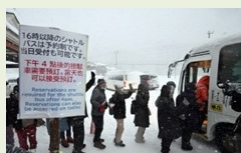
缓解拥堵措施 (「停车换乘 Park & Ride」试点验证)