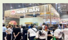
面向当地消费者的旅游博览会 参展与活动举办