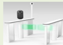
出入境通关便利化 (步行式自助通关闸机)