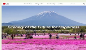
通过 JNTO(日本政府观光局)特 设页面发布园艺博览会相关信息