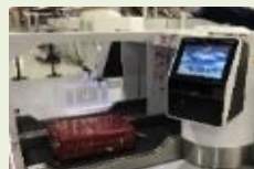
出入境通关便利化 (自助行李托运机)