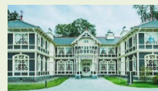
对外开放重要文化财 (旧三笠酒店)