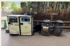
不文明行为对策 (智能垃圾桶)