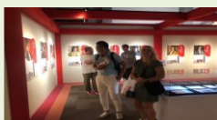
完善与当地渊源深厚的文化 财等展示设施