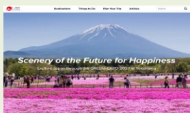
透過 JNTO(日本政府觀光局)特 設網頁發布園藝博覽會資訊