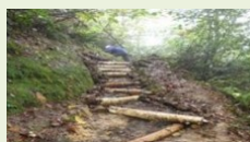
完善登山步道等設施