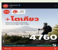
與航空公司聯合宣傳 推廣日本各地的魅力