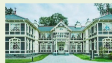
對外開放重要文化財 (舊三笠酒店)