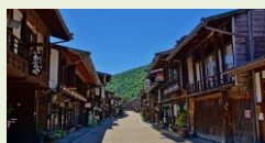
透過修繕歷史資源、電線桿地下 化及街景美化等完善街區風貌