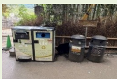
防治失禮行為的對策 (智能垃圾桶)