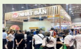
針對當地消費者的旅遊博覽 會參展與活動舉辦