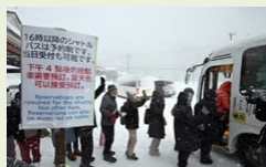
紓解擁擠的對策 (「停車轉乘 Park & Ride」實證實驗)