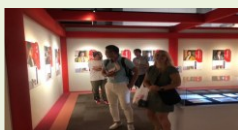
完善與當地淵源深厚的文化 財等展示設施