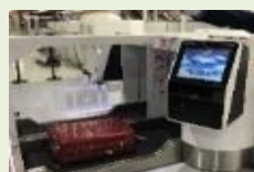
出入境通關便利化 (自助行李託運機)