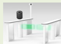
出入境通關便利化 (步行式自助通關閘門)