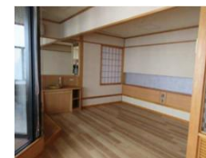
バリアフリー客室の整備 （ユニバーサルツーリズムの促進）