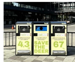
スマートごみ箱の設置