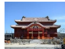
国営公園等での自然的・歴史的 景観等の観光資源活用 （首里城の復元）