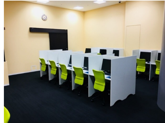
試験会場の全体図