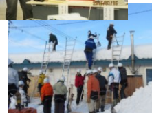
雪下ろし安全講習会