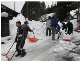
除雪ボランティアによる除雪活動