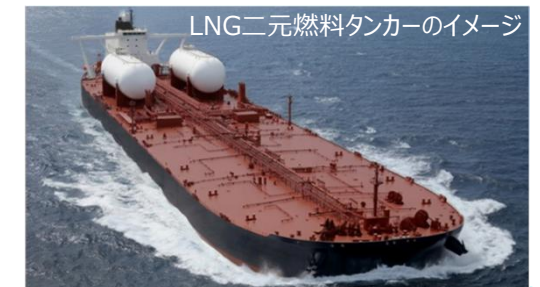
LNG二元燃料タンカーのイメージ

<実施場所> JMU(株) 有明事業所(熊本県長洲町)、呉事業所(広島県呉市)、津事業所(三重県津市)、本社(神奈川県横浜市)、JMUアムテック(兵庫県相生市)