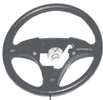
ステアリングホイール