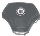
エアバッグモジュール