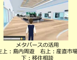
メタバースの活用