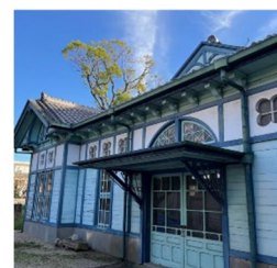
旧額田郡物産陳列所