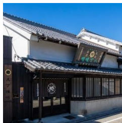
(株)まるや八丁味噌事務所棟