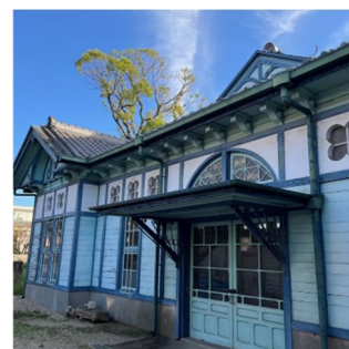
旧額田郡物産陳列所

江戸時代初期より豆味噌を造り続ける老舗のひとつ「まるや」の事務所棟。旧東海道の町家の意匠を残す。第 6 号岡崎市景観重要建造物。2