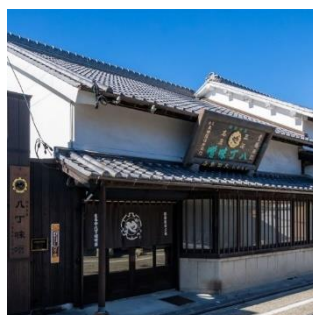
株まるや八丁味噌事務所棟

岡崎城旧本丸に位置し、諸願成就や開運守護のお社として信仰される神社。祭神は徳川家康公、本多忠勝朝臣、天神地祇、護国英霊。