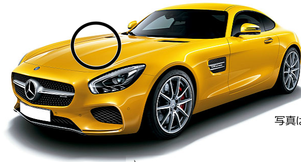
写真は左ハンドル仕様車