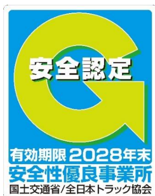
認定マーク『Gマーク』

Gマーク（安全性優良事業所）は、全日本トラック協会が認定（国土交通省推奨）する評価制度です。今回の認定により、Gマーク事業所は全国で 29,069 事業所（全てのトラック事業所の 33.9% 、対前年度比 0.5 ポイント増。）となり、更に、安全運行を励行するトラックが増えています。 トラックはひとたび事故を起こせば、重大事故に発展することが多く、被害は甚大です。 2023年（1月～12月）の事業用トラック1万台あたりの事故件数を取りまとめたところ、Gマーク認定を取得したトラックの死亡・重傷事故の件数は、認定を取得していないトラックと比較して30%以下となっています。