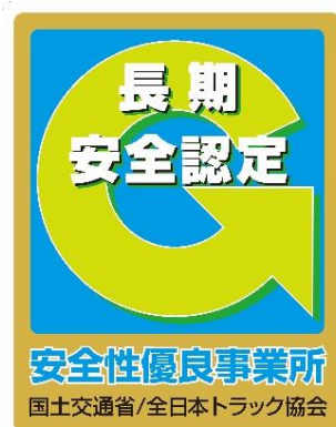
長期認定事業所用『ゴールドGマーク』

2023年（1～12月）中における車両1万台あたりの事故発生件数 Gマーク営業所の死亡・重傷事故割合は、未取得営業所と比較して、30%以下。