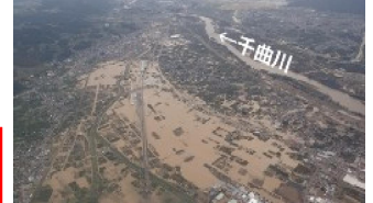
令和元年東日本台風（千曲川（長野県）） 大雨特別警報が大雨警報に切替えられた後 住民が避難先から自宅に戻り孤立・救助