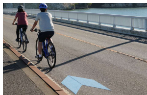
（矢羽根型路面表示設置状況）