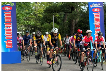
（毎年開催の「ツールドのと」）