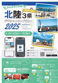
（スタンプラリー案内チラシ）