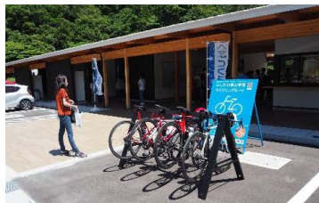
（サポート施設設置状況）