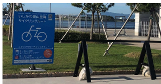
（サポート施設の案内看板設置状況）