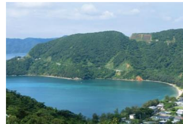
(ハートが見える風景)