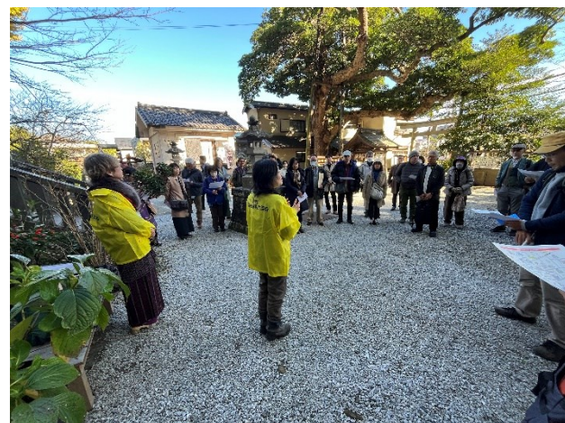
@鎌倉市／長谷町歩き「鎌倉の歴史ある街並みを訪ね歩く」