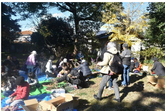
@藤沢市／旧モーガン邸で楽しむ自然素材のリース作り