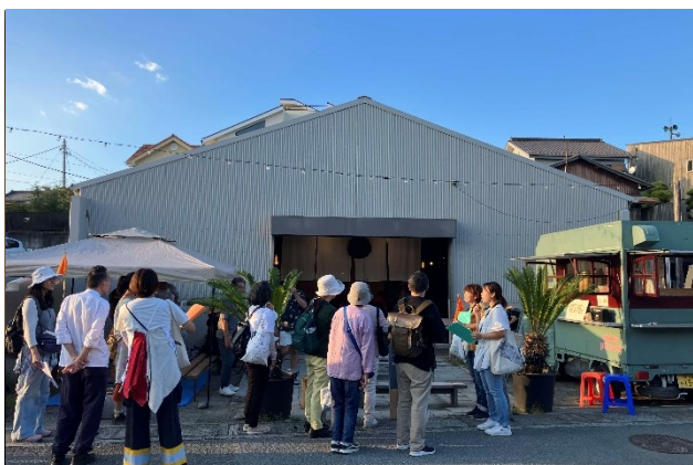
@小田原市／地元っ子と路地裏さんぽツアー