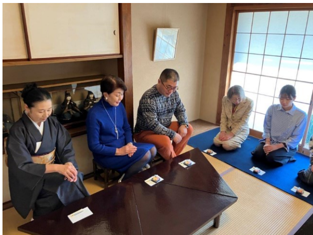
@葉山町／山口蓬春記念館 錦秋の呈茶会