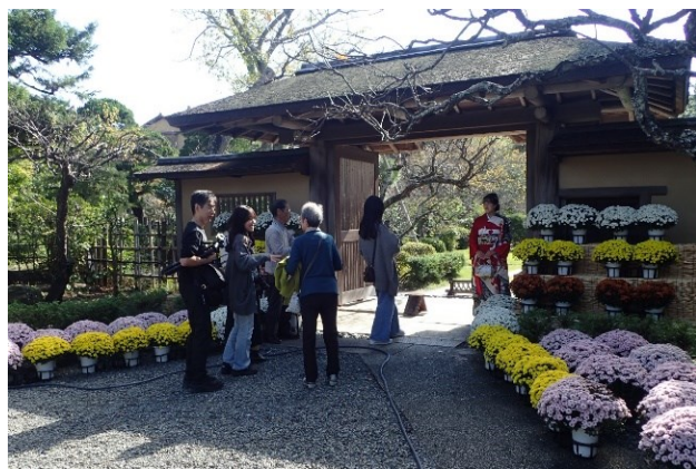
@大磯町／大磯城山公園「ざる菊の展示」