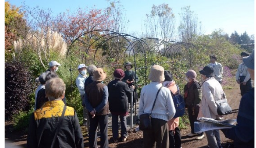
埼玉県三芳町「月の原ガーデン」散策

(2) 実施概要：ガーデン・ツーリズム登録の施設である、埼玉県三芳町へ研修旅行に行き、交流と現在の取組等について学びました。